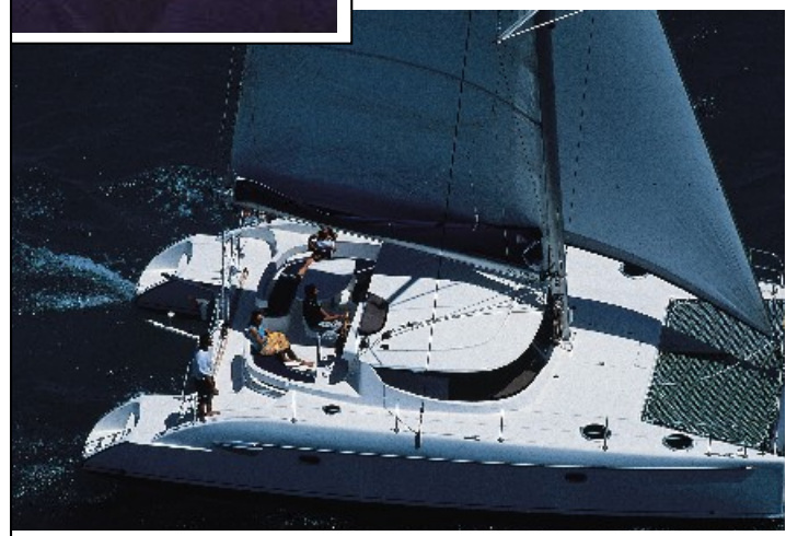
Länge: 11,90 m, Breite: 6,50 m Tiefgang: 1,10 m, Motor: 2 x 20PS

RUND MALLORCA: Palma de Mallorca - Andraitx - Soller - Lagune von Sa Calobra - Puerto Pollensa - Cala Ratjada - Puerto Christo - Puerto Colom Cala Figuera - evtl. Cabrera - Palma.